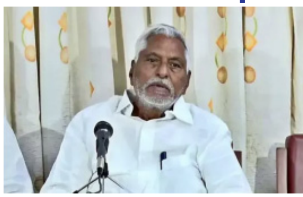
తెలుసుకున్నారు. మెరుగైన వైద్యం అందించాలని సూచించారు. ఆయన త్వరగా కోలుకోవాలని ఆకాంక్షించారు.