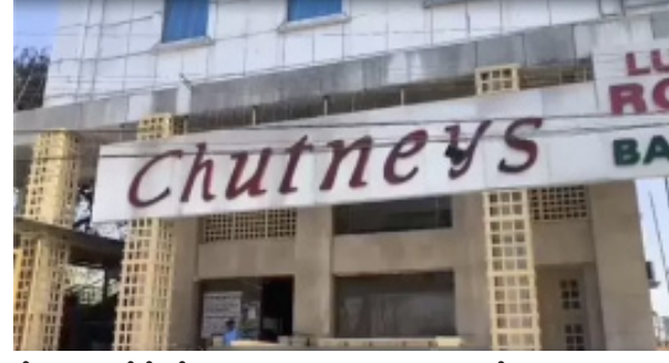
వేడెక్కుడంతోనే పేలుడు సంభవించిందా? ఇంకేమైనా కారణాలు ఉన్నాయా? అనే కోణంలో పోలీసులు దర్యాప్తు చేస్తున్నారు.

హైదరాబాద్: ఎల్బీనగర్ లోని ఆర్యపూర్ చట్నీస్ హోటల్ లో పేలుడు సంభవించింది. భారీ శబ్దానికి వినియోగదారులు పరుగులు తీశారు. ఈ ఘటనలో ముగ్గురు హోటల్ సిబ్బందికి తీవ్రగాయాలయ్యాయి. క్షతగాత్రులను ఆస్పత్రికి తరలించి చికిత్స అందిస్తున్నారు. ఇడ్లీ స్టీమ్ లో పేలుడు సంభవించినట్లు తెలుస్తోంది. సమాచారం తెలుసుకున్న ఎల్బీనగర్ పోలీసులు ఘటనా స్థలికి చేరుకొని సహాయక చర్యలు చేపట్టారు. అధిక వేడిమి కారణంగానే స్టీమ్ పేలిపోయినట్లు పోలీసులు ప్రాథమికంగా అంచనాకు వచ్చారు. పోలీసులు, హైద్రా సిబ్బంది, బాంబు స్వాడ్ బృందాలు పేలుడు సంభవించిన కిచెన్ ను పరిశీలించాయి. ఇడ్లీ స్టీమ్ లో