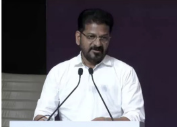
ఏఐ ఫలితాలు మన కోసం చూస్తున్నాయి. మనీషి కంటే ఏఐకి ఎక్కువ తెలివితేటలు ఉన్నాయి” అని సీఎం రేవంత్ రెడ్డి అన్నారు.

దిల్లీ: దిల్లీలో జరుగుతున్న ఏఐ సదస్సులో తెలంగాణ సీఎం రేవంత్ రెడ్డి పాల్గొన్నారు. ఏఐ శకం ఇప్పటికే మొదలైందని అన్నారు. “గతంలో పారిశ్రామిక విప్లవం వచ్చింది. ఇప్పుడు సాఫ్ట్వేర్ విప్లవం సదుస్తోంది. ఏఐ రంగంలో భారత్ గ్రోబల్ లీడర్ గా ఎదగాలి. ఏఐ అభివృద్ధి కోసం ప్రత్యేకమైన వార్ రూమ్ ఏర్పాటు చేయాలి. ఏఐ వార్ రూమ్ కోసం హైదరాబాద్ ఎంతో అనువైన ప్రదేశం. హైదరాబాద్ లో ఏఐ వర్కింగ్ ఇప్పటికే సకల వసతులతో ఏర్పాటు చేశాం. ఏఐ రంగంలో ఎన్నో అవకాశాలు ఉన్నాయి. వాటిని భారత్ అందిస్తున్నట్లుగా. ఏఐలో స్టార్టప్ లను ప్రోత్సహించాలి. ప్రతి ఆరు నెలలకోసారి హైదరాబాద్ పంటి ప్రదేశంలో ఏఐ సదస్సులు జరగాలి” అని రేవంత్ అన్నారు. ప్రపంచంలోని టెక్నాలజీ దిగ్గజాలన్నీ ఈ సదస్సుకు వచ్చాయని, ఆలోచనలే మన జీవితాలను మార్చివేస్తాయని చెప్పారు. మనీషి అత్యున్నత ఆవిష్కరణ అయిన